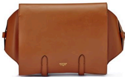
Messenger in pelle con chiusura dalla doppia fibbia, Bertoni 1949