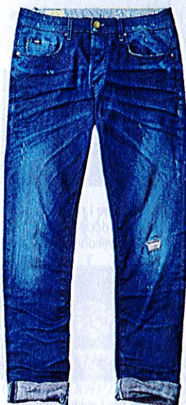
Jeans used, Gas (€ 169).