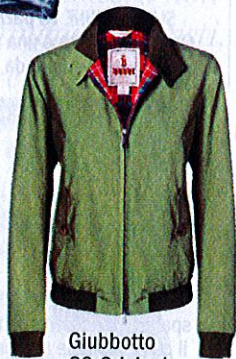
Giubbotto G9 Original, Baracuta (€ 299).