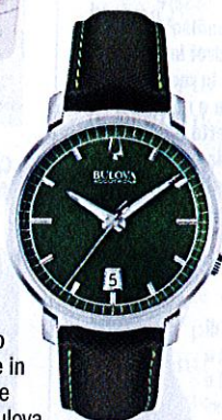
Orologio Telluride in acciaio e pelle, Bulova (€ 375).