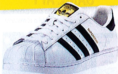
Sneakers Superstars, adidas Originals per AW LAB (€ 90).