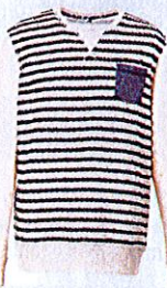
Pull rigato, Kiabi (€ 20).