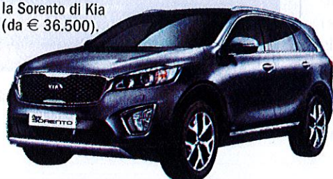
Nuovissima la Sorento di Kia (da € 36.500).

Dopo il trionfo agli Australian Open in coppia con Simone Bolelli, "il più bello del tennis italiano" si racconta a Cosmo ... Data di nascita: 24 maggio 1987 Luogo di nascita: Sanremo Segno zodiacale: Gemelli Fabio, perché il tennis? «A quattordici anni giocavo a calcio, ma poi ho puntato sul tennis: è uno sport individualista e preferisco mettermi in gioco in prima persona».