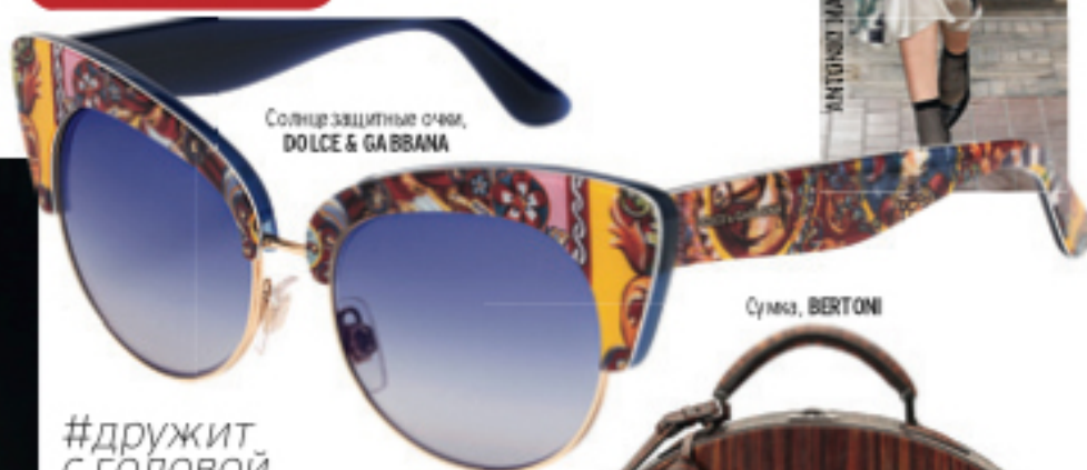
Солнцезащитные очки, DOLCE & GABBANA