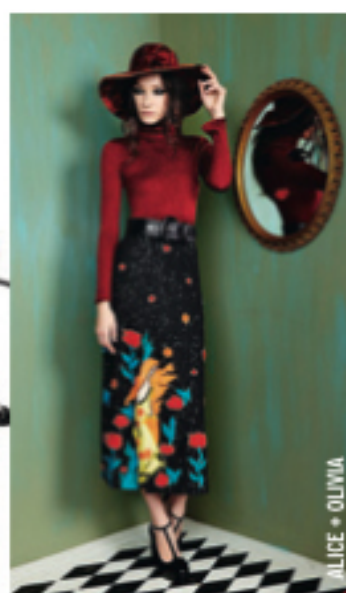
ALICE + OLIVIA

Броши в самых неожиданных местах и вставки из кожи рептилий — неизменные рег-атрибуты образа в стиле бохо.